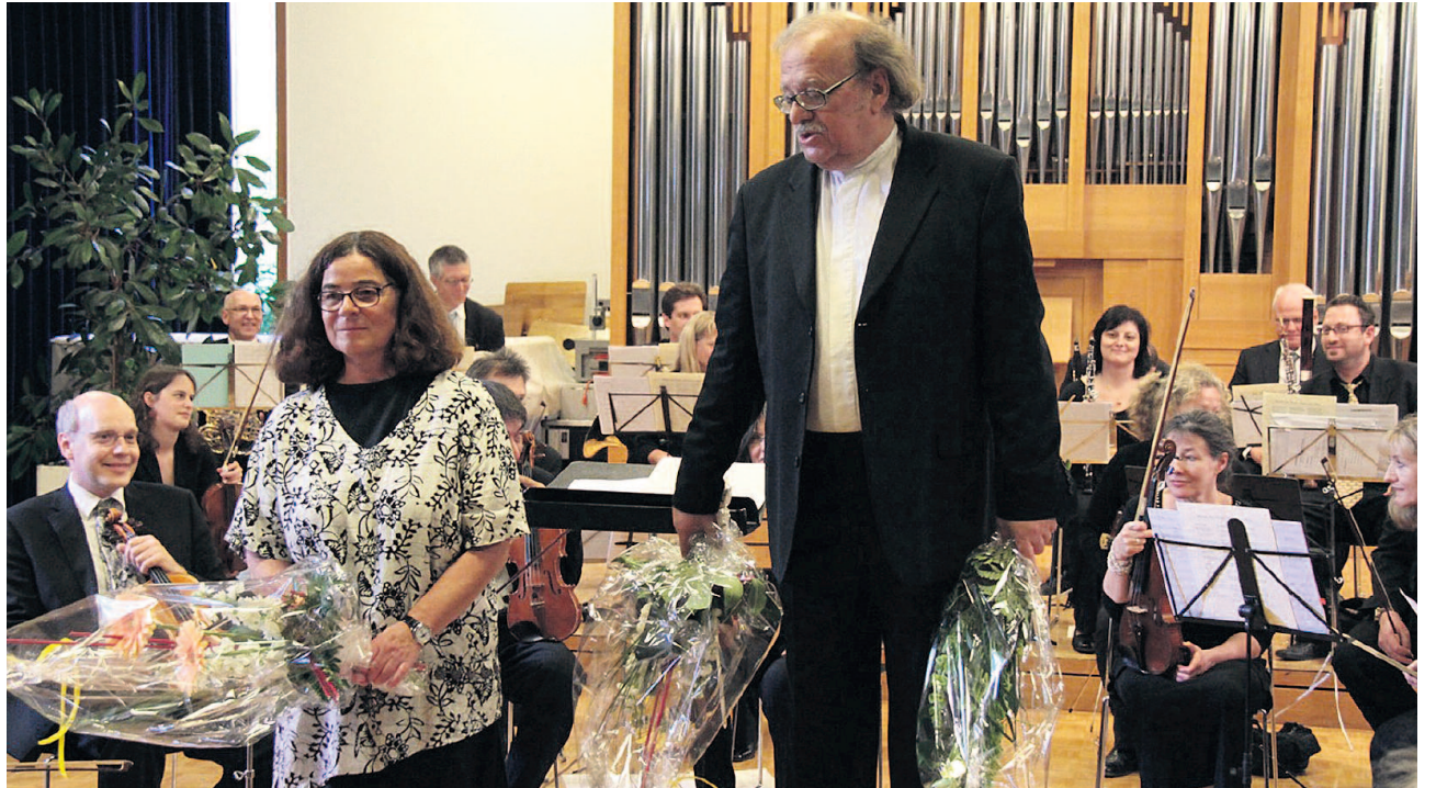
Blumen für Sprecherin und Komponist: Enrico Lavarinis «Dornröschen»-Komposition verzaubert Klein und Gross.

Das Publikum dankte mit entsprechendem Applaus, und verfolgte anschliessend mit Interesse die speziellen Ausführungen Enrico Lavarinis zu seiner Märchen-Komposition «Dornröschen» – er wandte sich damit insbesondere an die etlichen Kinder im Publikum, um ihnen einen Verständnishintergrund für die nach der Pause folgende Interpretation des Märchens zu geben. Der Komponist beschrieb und erklärte zudem die Orchesterinstrumente,, und auf welche Weise er